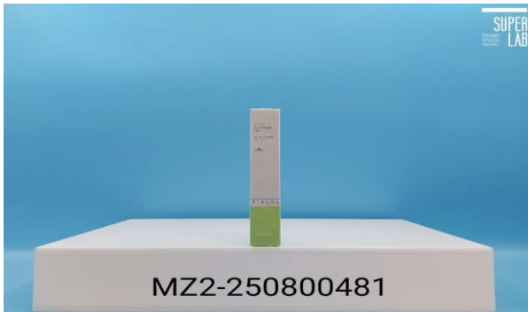
圖一： 試驗物質外觀。