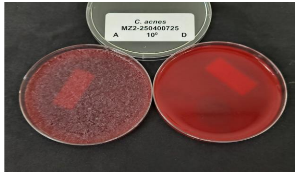
圖二： 對照組及試驗物質作用後之結果。