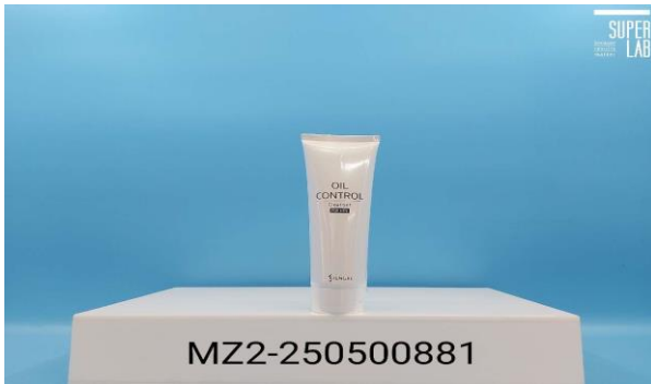
圖一： 試驗物質外觀。